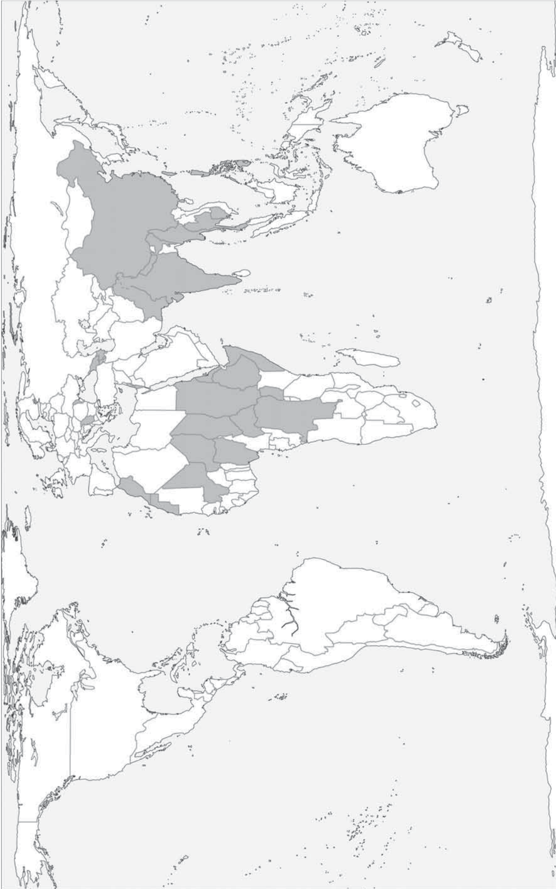
■ Països amb processos de pau o negociacions formalitzades (Indicador núm. 3)