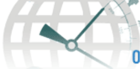
Taula 1.1. Resum dels conflictes armats 3er trimestre 2008