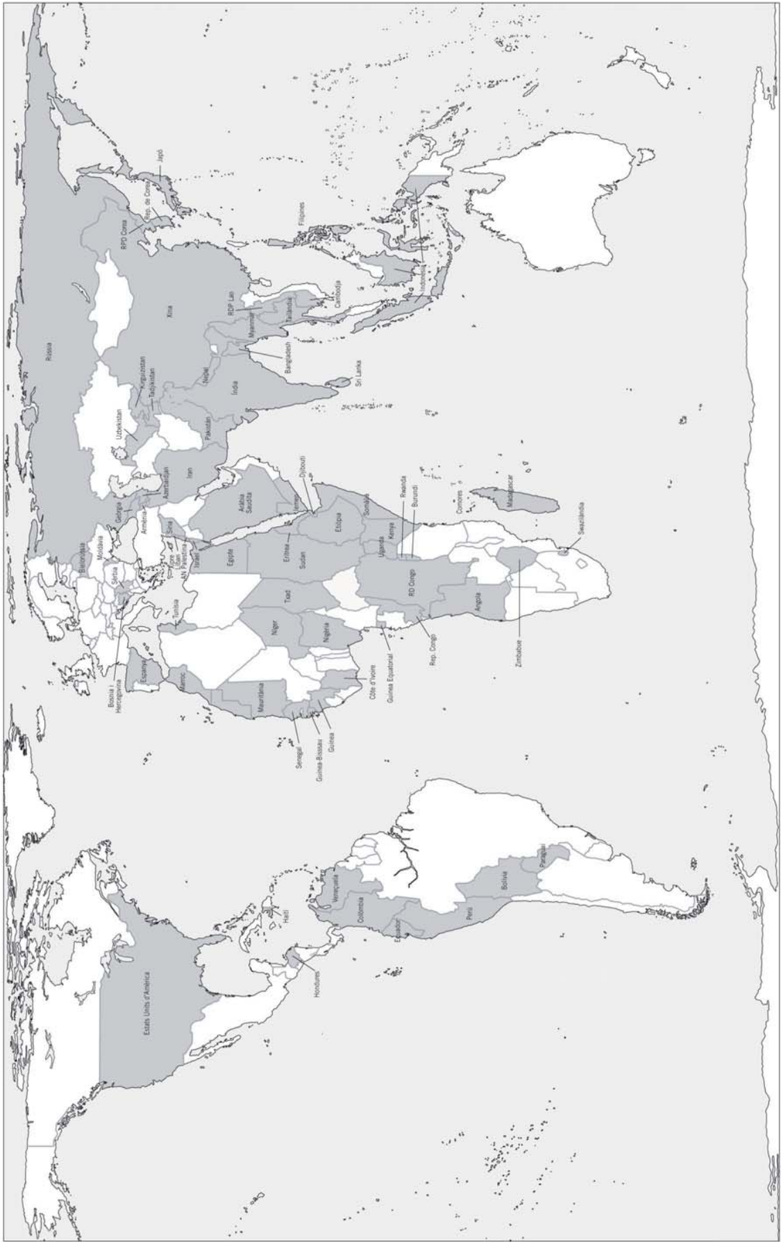
■ Països amb situacions de tensió (indicador núm. 2)