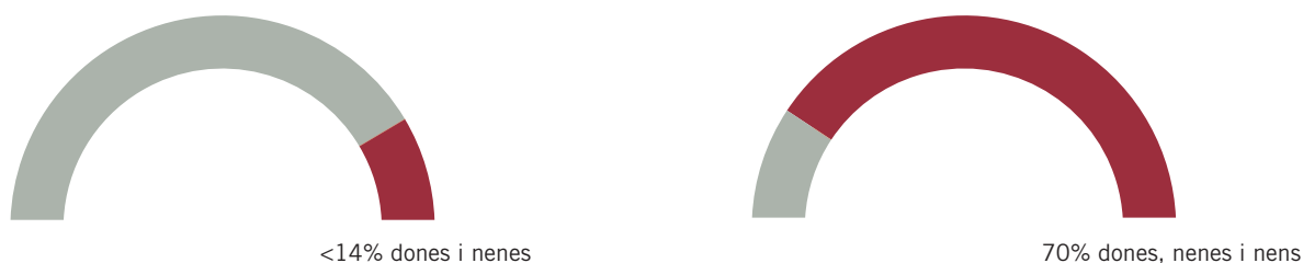
Gràfica 2: Canvi en la demografia de les morts palestines

Entre el 2008 i el 7 d'octubre del 2023, les Nacions Unides havia registrat 6.542 palestins/es i 308 israelians morts en hostilitats. Menys del 14% eren dones i nenes.