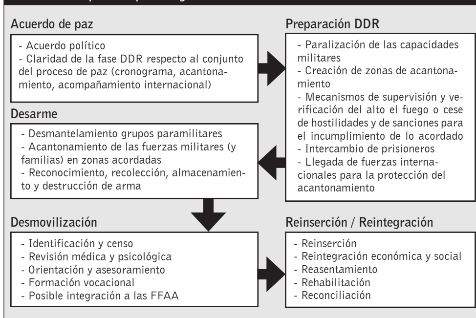
Gráfico 1. El proceso para llegar al DDR

Hasta la fecha, ningún programa de DDR ha dado unos resultados óptimos, debido a las deficiencias detectadas en varios ámbitos , ya sea por una planificación defectuosa, una implementación que no atiende suficientemente a los grupos en situación de mayor vulnerabilidad o por mecanismos de seguimiento y evaluación poco efectivos.