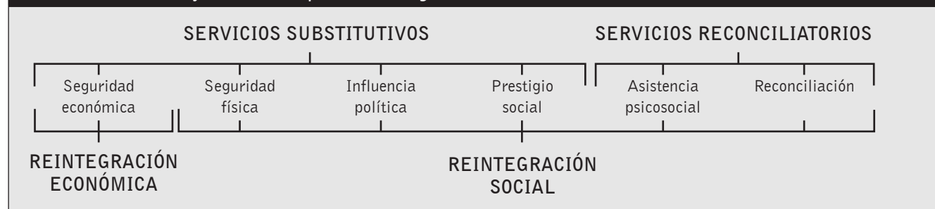
Gráfico 2. Servicios y necesidades para la reintegración

El riesgo de este enfoque más general de la reintegración recae en la posible marginación de ciertos grupos armados en caso que no se realice una efectiva cobertura geográfica y política. Si se le suma al hecho que los beneficios no se dirigen directamente a los antiguos combatientes, este enfoque es una posible fuente de inseguridad. Además, otro problema que se presenta es el de la elegibilidad. Si bien en un enfoque de reintegración individualizada se debe establecer una clasificación del tipo de combatientes que se pueden acoger a este tipo de programas (porte de armas, antigüedad, menores-soldado,...), el enfoque centrado en la comunidad tiene el reto de definir que se entiende como comunidad 39 . Este concepto deberá analizarse en cada uno de los casos en función del contexto: rural, urbano, círculo más próximo al ex combatiente, localidad de acogida, etc.