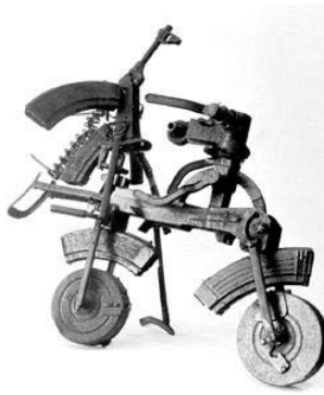
Motociclista, de F. Rosa.