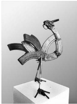
Passeante, de Hilario.

- Transformação de Armas em enxadas 8 , va ser un projecte impulsat a Moçambic el 1995 que va perseguir “establir una cultura de pau i recolzar i mantenir una transició postbèlica pacífica al país, enfortint la reconciliació, la democràcia, la societat civil i encoratjant a la població a participar en activitats de manteniment de la pau”. La tercera fase del projecte va consistir a convertir les armes destruïdes en escultures, en la qual van participar 14 escultors de l'associació d'artistes Núcleo de Arte .