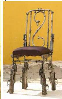
Cadeira feta per Petsampeseth

- Sculptures pour la paix 11 , Haití. L'escultora Barbara Prezéau va idear aquest projecte amb l'objectiu de “donar a conèixer la realitat del DDR al país i reflexionar sobre el paper dels artistes haitians”. Va comptar amb la col·laboració de 30 escultors que durant 15 dies van transformar armes decomissades en escultures com a part del programa de DDR que el PNUD va dur a terme al país.