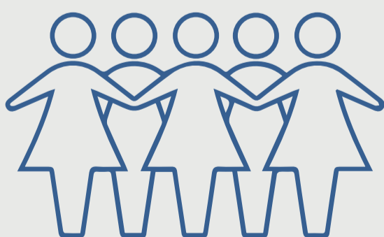
Propuestas de recuperación feminista de WILPF:

Organizaciones de mujeres, académicas y activistas feministas se han movilizado durante la pandemia, han cuestionado el enfoque de “crisis nueva” y han planteado propuestas de construcción de paz