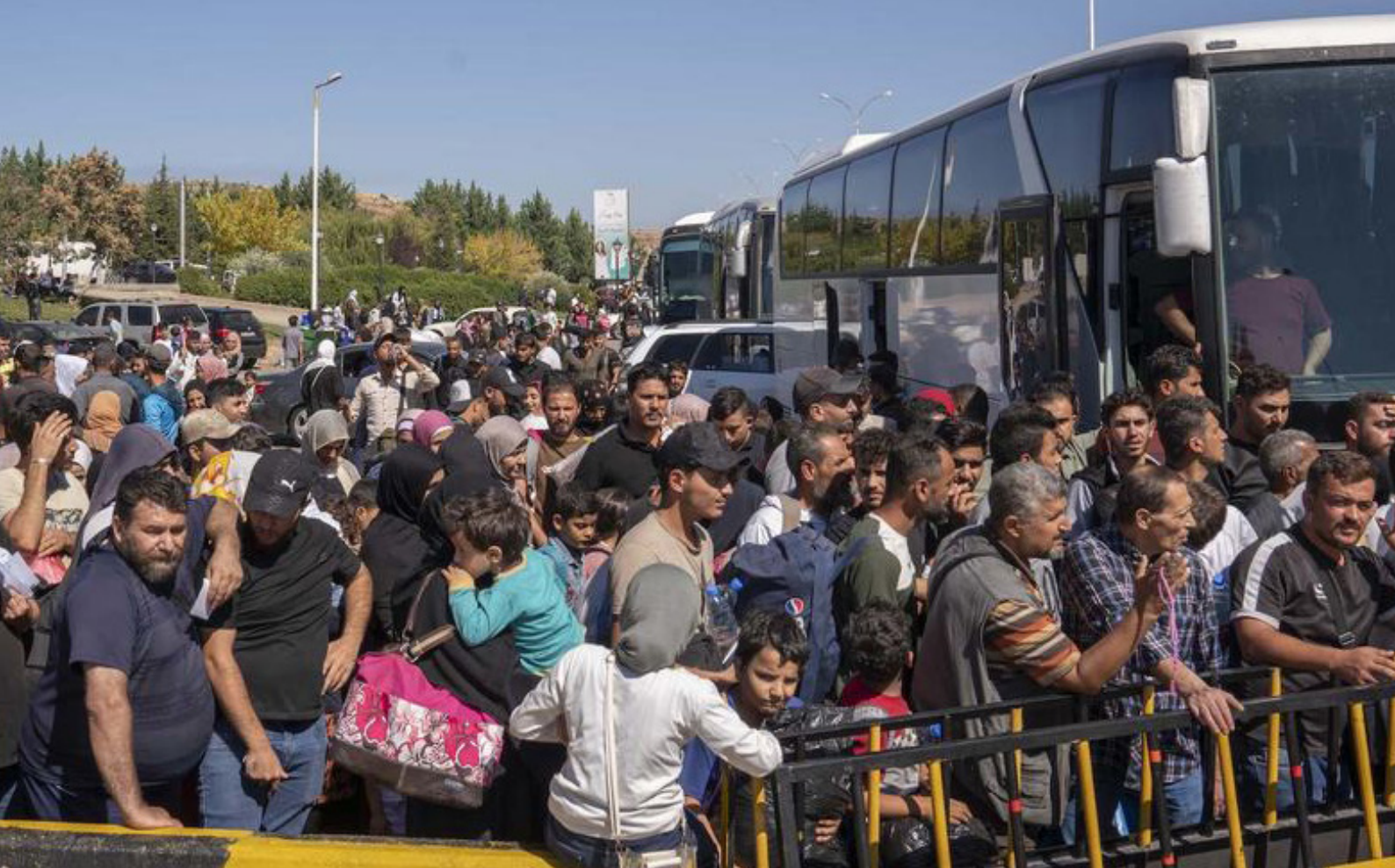
Famílies sirianes i refugiades, arribant a Síria.